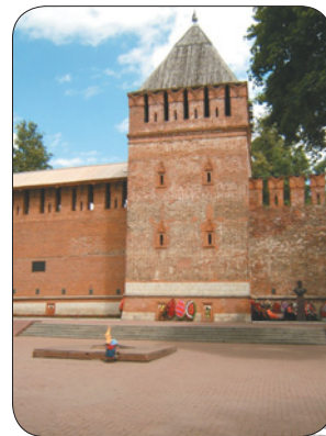
▲ Смоленская крепость. Башня Донец.

Только в 1395 г. литовскому князю Витовту хитростью удалось захватить Смоленск. Как следует из исторических источников, князь понимал, что штурмом крепость ему не взять, и распространил слух, что идет в поход против татар. Когда он подошел к городу, любопытные смоляне вышли навстречу его войску. Через открытые ворота литовцы ворвались «в град, много зла учинили, много богатства зя, и много в плен поведе, и казни без милости». В 1401 г. восставшие смоляне отбили город. Витовт, не желая терять важнейший для себя пункт, вновь начал борьбу за него