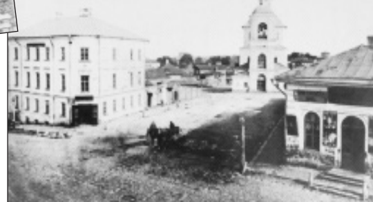
Перекресток М. Одигитриевской и Б. Благовещенской улиц. 1870-е гг.

ворот передали Обществу попечения о детях, с 1899 г. эта часть стала называться Пушкинским садиком. Здесь установили для детей качели, гимнастические снаряды, «гигантские шаги», беседки в «китайском» стиле. Украшением Лопатинского сада часто становились выставки смоленского отделения Общества садоводства. В 1881 г. на Кировской улице заложили небольшой сад Эрмитаж.