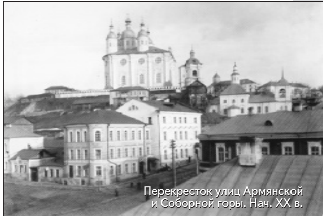
Перекресток улиц Армянской и Соборной горы. Нач. XX в.

Первая и вторая части города охватывали все