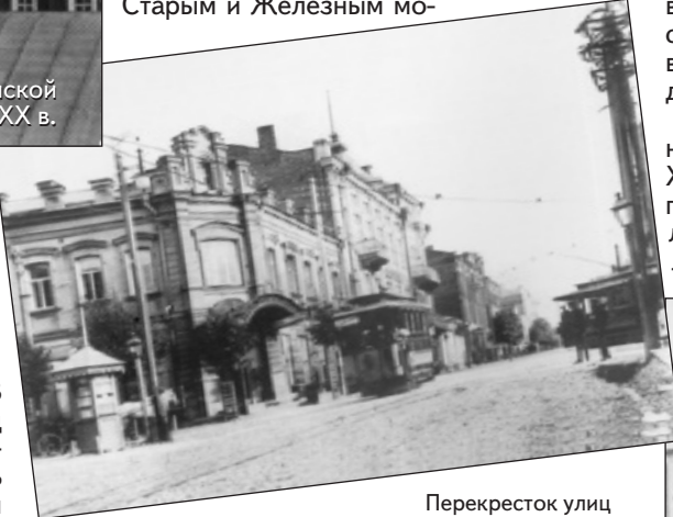
Перекресток улиц Б. Благовещенской, Пушкинской и Малой Одигитриевской. Нач. XX в.

Как всякий уважающий себя город, Смоленск украшался бульварами, набережными, площадями. Бульваров было немного, и почти все они располагались на месте скрытых или засыпанных старых городских укреплений. В Заднепровье в 1858 г. на месте скрытых предместных укреплений устроили три бульвара. Один был между Старым и Железным мо-