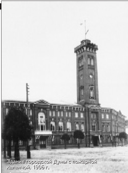
Здание городской Думы с пожарной каланчой. 1906 г.

В се русские города по внутреннему укладу жизни во многом похожи друг на друга. Но внешне, как и русская природа, они неповторимы. Ярким подтверждением этого служат как Смоленск, так и уездные города Смоленской губернии.