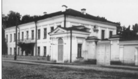
Дом смоленского губернатора. 1906 г.

ства попечения о народной трезвости. Название бульвар получил в честь губернатора Василия Осиповича Сосновского. В годовщину 100-летия войны 1812 г. к западу от Молоховских ворот открыли бульвар Памяти героев 1812 года. Напротив гимназии, вдоль Королевской улицы, проходил Гимназический бульвар.