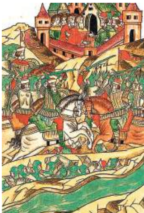
Рис. 5. Битва смоленских и литовских войск на реке Вехре близ Мстиславля в апреле 1386 г. Миниатюра Лицевого летописного свода, XVI в.

Князь Глеб был старшим сыном Смоленского великого князя Святослава Ивановича (1359–1386). Однако, когда в битве на реке Вехре близ Мстиславля (рис. 5), состоявшейся в апреле 1386 г., Святослав Иванович погиб, а его сыновья попали в плен (рис. 6), Глеб был оставлен в заложниках, а Юрий отпущен на княжение в Смоленск в качестве вассала Литвы (Гуда-