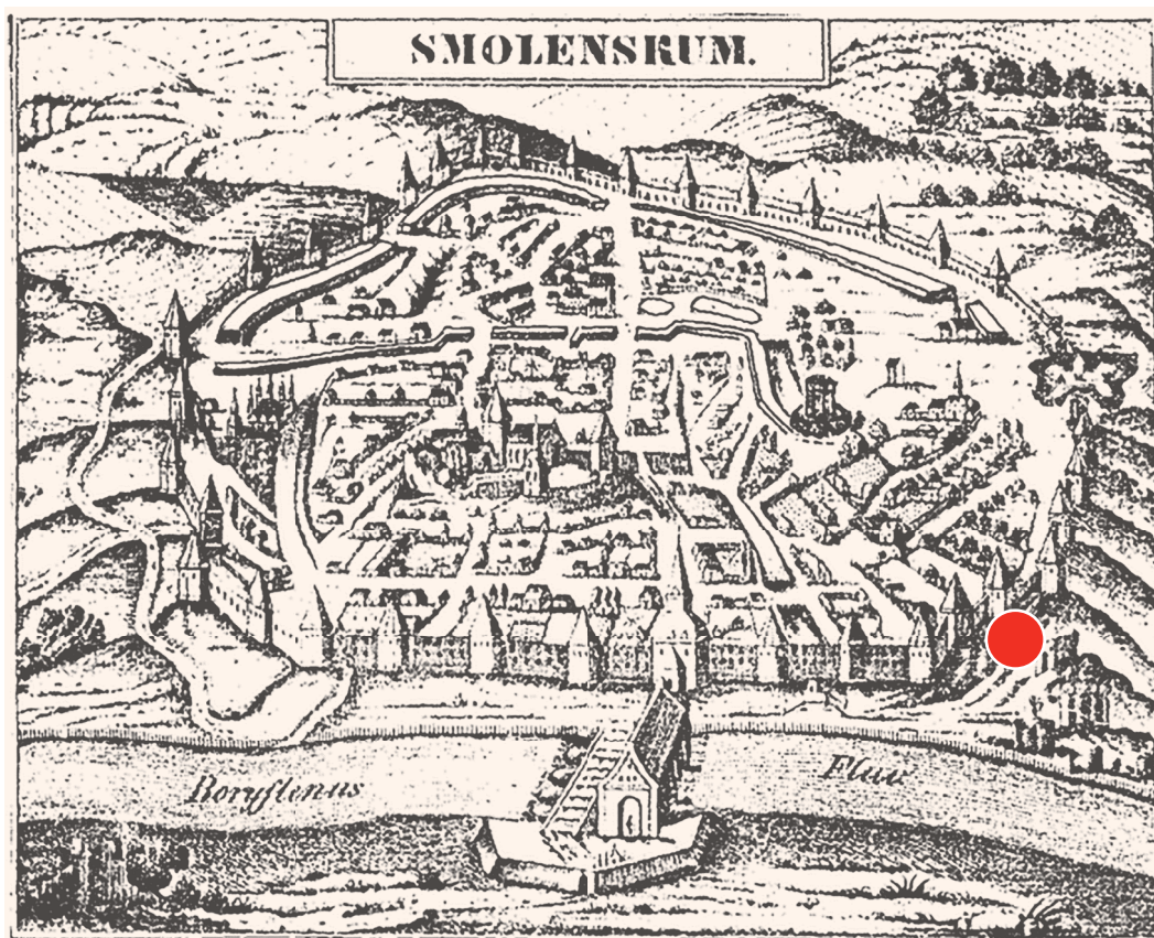
Рис. 1. План Смоленска 1611–1629 гг. с указанием района исследований 2012–2013 гг. Без масштаба

женного раскопа в ходе археологических наблюдений было зафиксировано скопление плинфы. После такой находки площадь раскопок была увеличена вдвое по сравнению с обусловленной археологическим проектом, полностью перекрыв собой место обнаружения предполагаемых архитектурных остатков, а прирезанный участок получил наименование «раскоп 2». Специалистами САБ в 2012 г. была выполнена предварительная расчистка фрагментов храма. Впоследствии, после его изучения экспедицией Института археологии РАН под руководством Вл.В. Седова, в 2013 г. осуществлена консервация остатков данного архитектурного памятника, в ходе которой был произведен отбор на радиоуглеродное АМС датирование и дендрологические анализы образцов раствора и углей из кладки и конструкций храма.