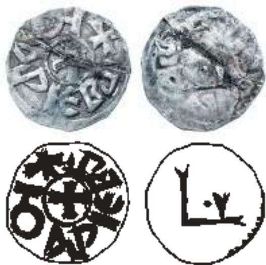
Рис. 4. Серебряная монета князя Юрия Наримунтовича Белзского. Увеличено в 2,5 раза. (Пашкевич Б., 2013. С. 12–17)

гались в бассейне Западного Буга (Пашкевич Б. 2013. С. 12–17; Саввов Р., 2014. С. 22–23). Примечательно, что «притяжательная» форма написания имени князя на этих монетах (рис. 4) также совпадает с использованной в легенде клейма, что позволяет усматривать в ней «западнорусское» влияние.