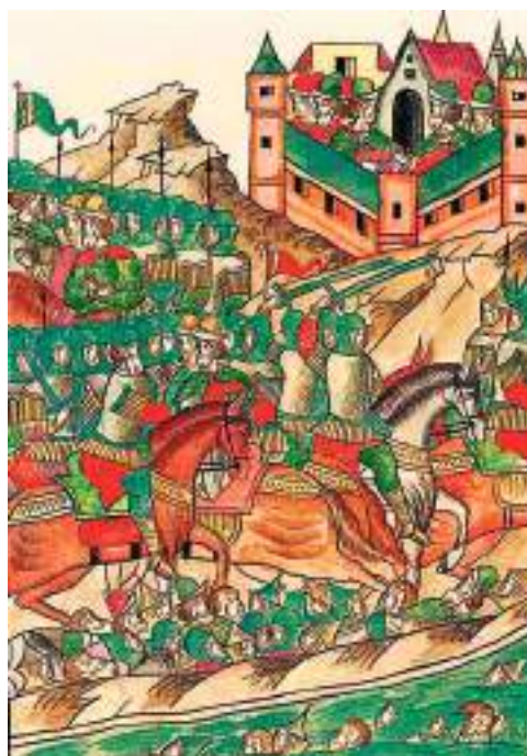
Рис. 6. Пленение литовцами в 1386 г. близ Мстиславля сыновей великого князя Смоленского Святослава Ивановича — Глеба и Юрия. Миниатюра Лицевого летописного свода, XVI в.