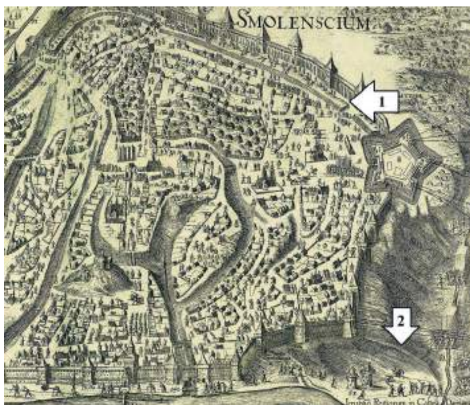
Рис. 2. Изображение атаки и обороны Смоленска 1634 года (фрагмент; по: Изображение..., 1847). 1 — «Старый вал позади стены находящийся, который составлял укрепление города прежде сооружения стен»; 2 — вал Пятницкого острога по мнению Н.В. Сапожникова

1 — предположительное местоположение Заднепровского острога; 2 — предположительное местоположение острога в Пятницком конце; 3 — предположительное местоположение острога в Крылошевском конце; 4 — Старый город; 5 — Каменная крепость; 6 — территория Пятницкого конца; 7 — территория Крылошевского конца; 8 — оборонительное сооружение у Копытинских ворот; 9 — оборонительное сооружение у Аврамьевских ворот. Церкви упоминаемые как стоящие на посаде: А — «Николая Летелого»; Б — «Григория Богослова»; В — «Петра и Павла»; Г — «Ильи Пророка»; Д — «Екатерины»